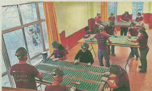
Un momento de un curso de un PFAE desarrollado en Las Palmas.