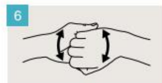
Frótese el dorso de los dedos de una mano contra la palma de la mano opuesta, manteniendo unidos los dedos.