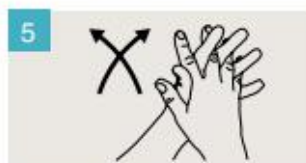
Frótese las palmas de las manos entre sí, con los dedos entrelazados.