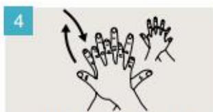
Frótese la palma de la mano derecha contra el dorso de la mano izquierda entrelazando los dedos, y viceversa.