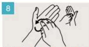
Frótese la punta de los dedos de la mano derecha contra la palma de la mano izquierda, haciendo un movimiento de rotación, y viceversa.