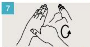
Rodeando el pulgar izquierdo con la palma de la mano derecha, fróteselo con un movimiento de rotación, y viceversa.