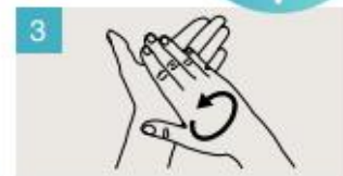
Frótese las palmas de las manos entre sí.