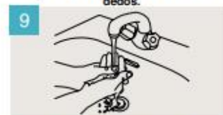
Enjuáguese las manos.