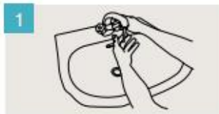
Mójese las manos.

DURACIÓN DEL LAVADO: entre 40/60 segundos