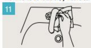
Utilice la toalla para cerrar el grifo.