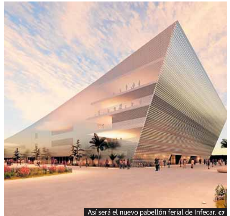
Así será el nuevo pabellón ferial de Infecar. c7

Con 146 metros de largo y 65 de ancho, el futuro pabellón prin-