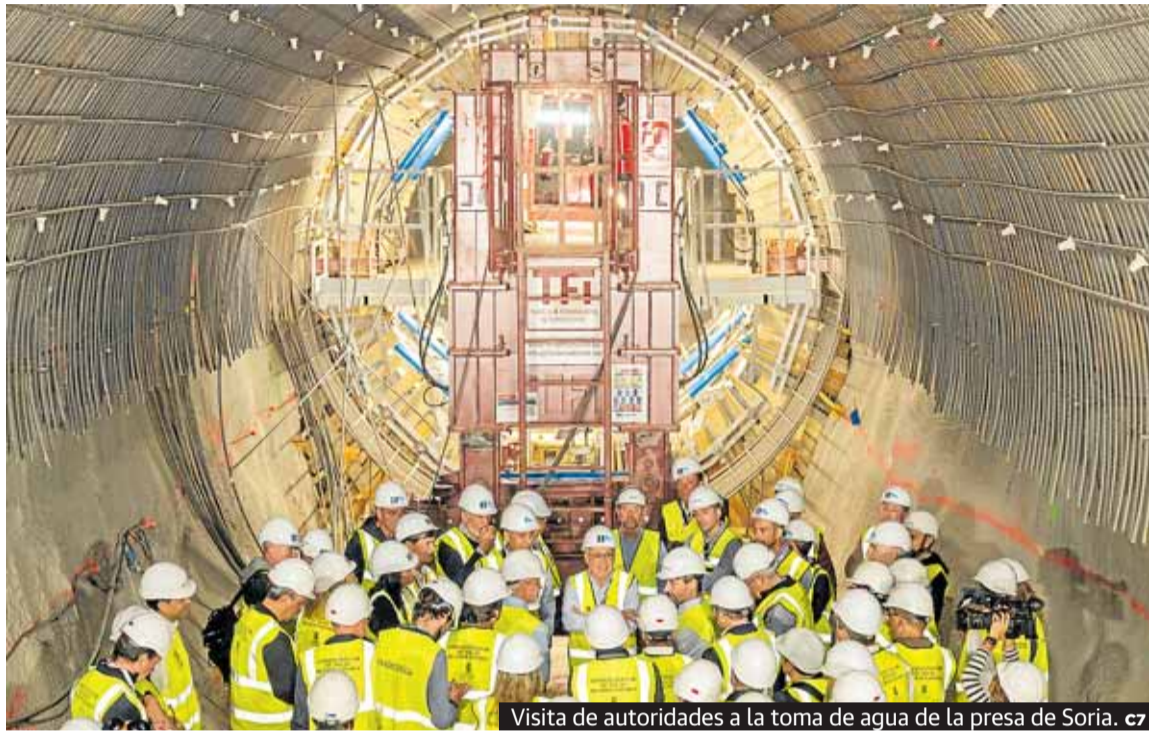
Visita de autoridades a la toma de agua de la presa de Soria. c7

E l progresivo incremento de su presupuesto, que en 2026 le mete en el club de los millonarios, y de su capítulo de inversiones, que supera este año los 220 millones, convierten al Cabildo de Gran Canaria en uno de los principales promotores de obra de la isla. Tres ejemplos dan fe de este hecho: la construcción de la central hidroeléctrica Salto de Chira, que prefinancia Red Eléctrica de España (REE) y pagará el Estado pero parte de una concesión del Consejo Insular de Aguas; la renovación del Estadio de Gran Canaria ya en marcha; y la creación del nuevo pabellón ferial de Infecar, en proceso de contratación. La primera es la obra pública más cara que se ejecuta en Canarias en muchas décadas.