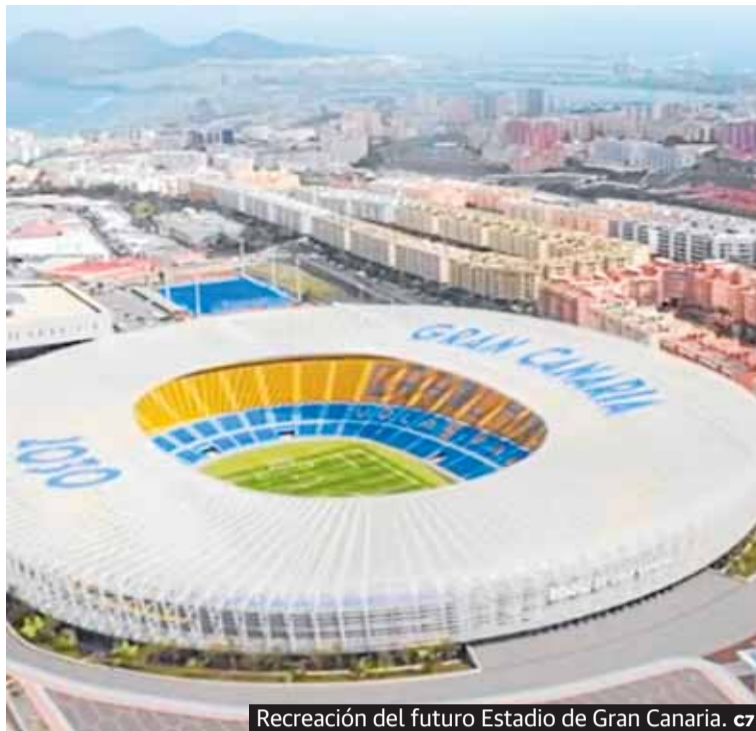
Recreación del futuro Estadio de Gran Canaria. c7

La explotación posterior del nuevo estadio permitirá recuperar la