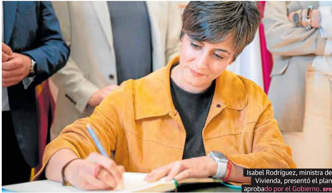
Isabel Rodríguez, ministra de Vivienda, presentó el plan aprobado por el Gobierno.

El Consejo de Ministros aprobó el pasado martes el real decreto que regula el nuevo Plan Estatal de Vivienda 2026-2030 que moviliza 7.000 millones de euros, el triple que el anterior plan, con el objetivo de elevar y proteger para siempre el parque público y protegido a precios asequibles.