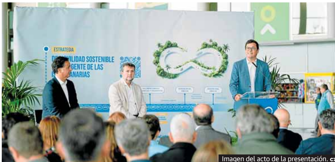
Imagen del acto de la presentación. c7

E l Gobierno de Canarias presentó este mes el Documento Básico de Análisis y Diagnóstico de la Estrategia de Movilidad Sostenible e Inteligente de las Islas Canarias (Movic), un hito clave que sienta las bases de la planificación del sistema de movilidad del Archipiélago para las próximas tres décadas. Este documento constituye el punto de partida de una hoja de ruta estructurada con horizontes en 2030, 2040 y 2050, orientada a dar respuesta a las singularidades de Canarias como región ultraperiférica y territorio fragmentado.